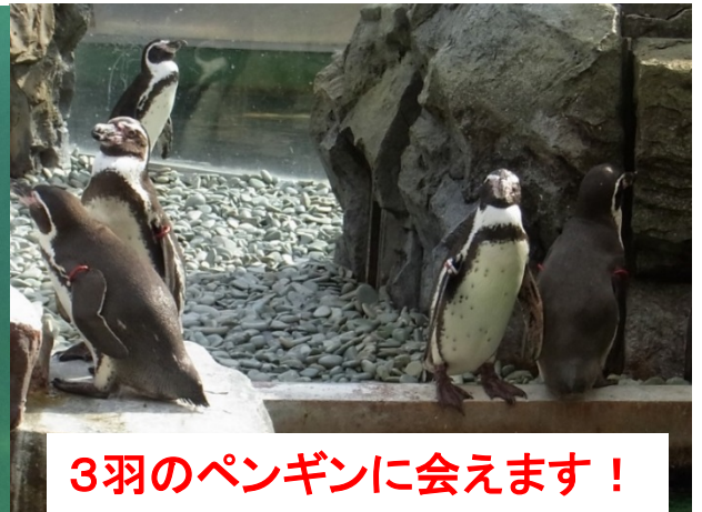
3羽のペンギンに会えます!